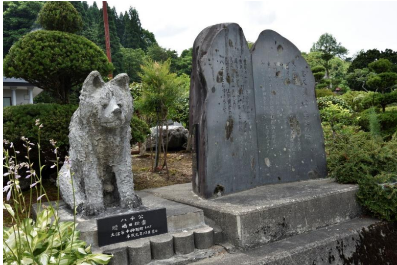
秋田県大館市比内町太子内の「忠犬ハチ公」の生誕地には記念碑があります。