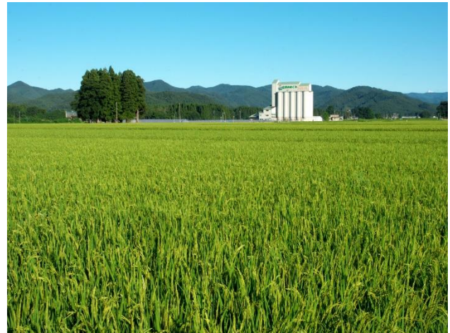
秋田県大館市比内町に設置された、比内カントリーエレベーター周辺の水田風景です。